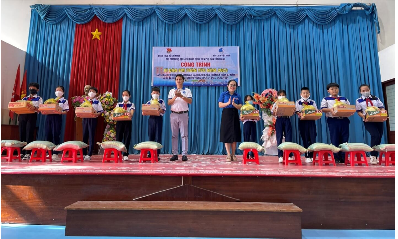
Tặng quà cho 50 em học sinh có hoàn cảnh khó khăn