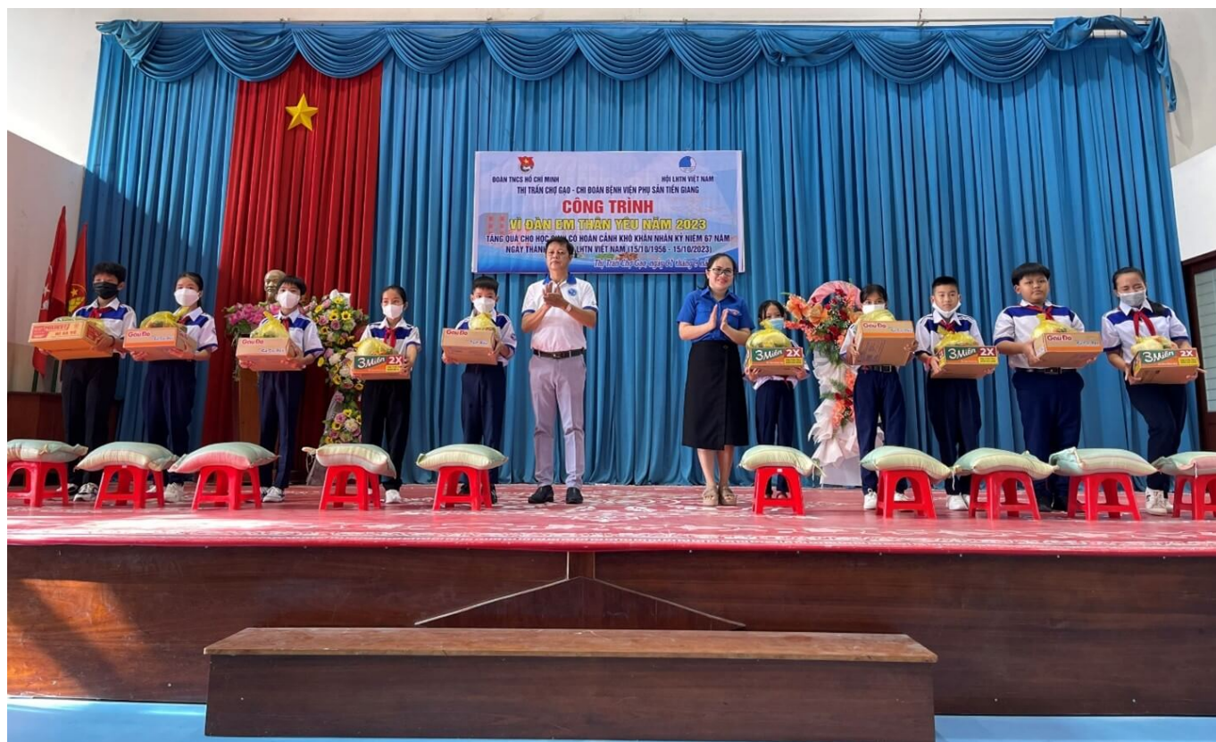
Tặng quà cho 50 em học sinh có hoàn cảnh khó khăn