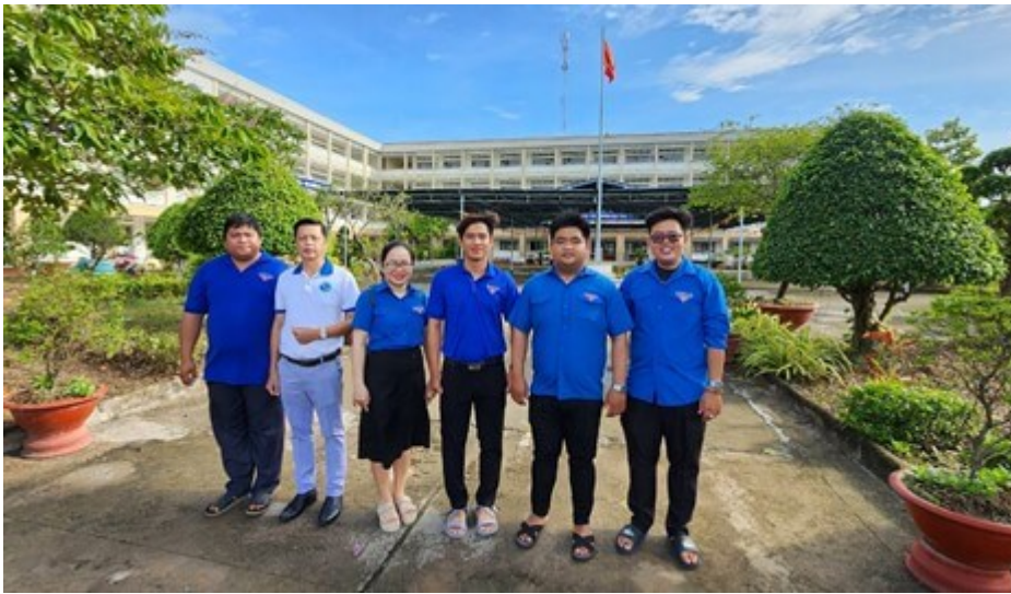
Đoàn Bệnh viện Phụ sản Tiền Giang tham gia hoạt động tại trường THCS thị trấn Chợ Gạo

Thực hiện nhiệm vụ công tác đoàn và hoạt động phong trào thanh thiếu nhi năm 2023 về việc đẩy mạnh thực hiện Chương trình “Vì đàn em thân yêu” gắn với tôn vinh những tấm gương học sinh tiêu biểu vượt khó học tốt. Nhân kỷ niệm 78 năm ngày Cách mạng tháng 8 thành công và Quốc khánh (2/9/1945 - 2/9/2023), 67 năm ngày thành lập Hội LHTN Việt Nam (15/10/1956 - 15/10/2023).