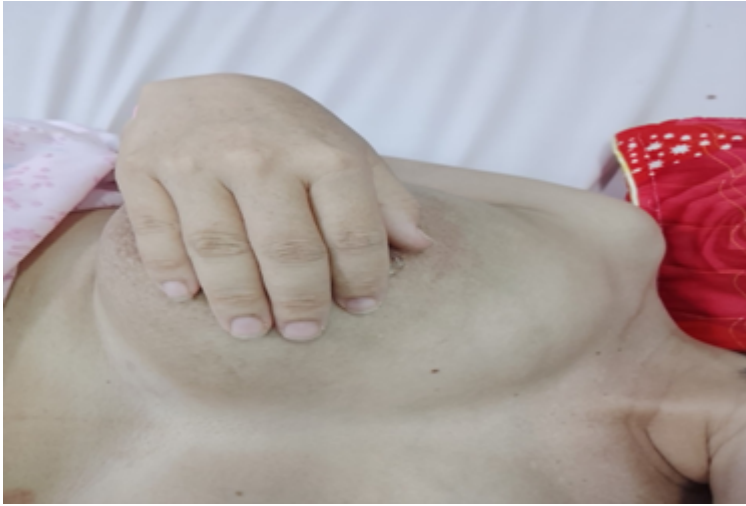
Tắc tuyến sữa sau sanh mổ ngày 4