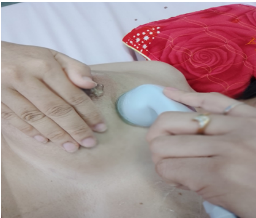
Sản phụ đang điều trị tắc tia bằng sóng siêu âm