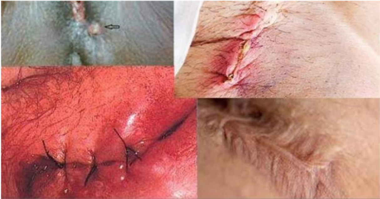
Nhiễm trùng vết may tầng sinh môn

Vết may tầng sinh môn bị nhiễm trùng nếu không được phát hiện và xử lý sớm dễ diễn tiến nặng khiến vết thương lâu lành, biến dạng vùng âm hộ,... vì vậy khi có các triệu chứng nghi ngờ kể trên cần trao đổi với bác sĩ hoặc đến khám ngay để được chẩn đoán và điều trị kịp thời.