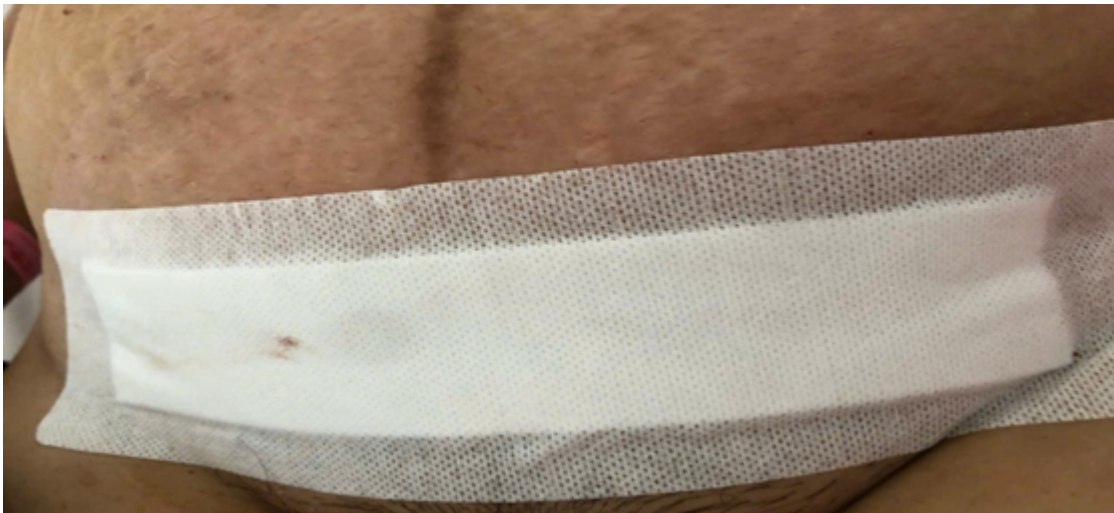
Vết mổ của bệnh nhân tại Khoa Hậu sản - Hậu phẫu ngày thứ 1 sau mổ