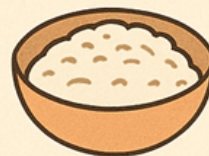
Ngũ cốc nguyên hạt