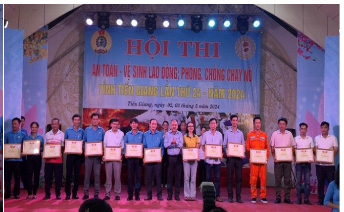
Bệnh viện Phụ sản (người thứ ba bên phải) nhận giải khuyến khích toàn diện

Kết quả Hội thi, Ban Giám khảo đã chọn ra các đội có thành tích xuất sắc trong số đó Bệnh viện Phụ sản Tiền Giang đã đạt thành tích "Giải nhì Thực hành PCCC" và "Giải khuyến khích toàn diện".