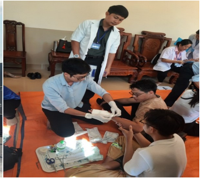
Ảnh CV, NLD Bệnh viện thực hành PCCC, CNCH và sơ cứu người bị nạn

Tổng cộng có hơn 700 thí sinh của 102 đội dự thi, riêng Bệnh viện Phụ sản Tiền Giang có 11 thí sinh tham gia dự thi tất cả 4 nội dung: Thực hành phòng cháy, chữa cháy, sơ cấp cứu tai nạn lao động; thi trắc nghiệm kiến thức; xử lý tình huống và xem hình đoán chữ.