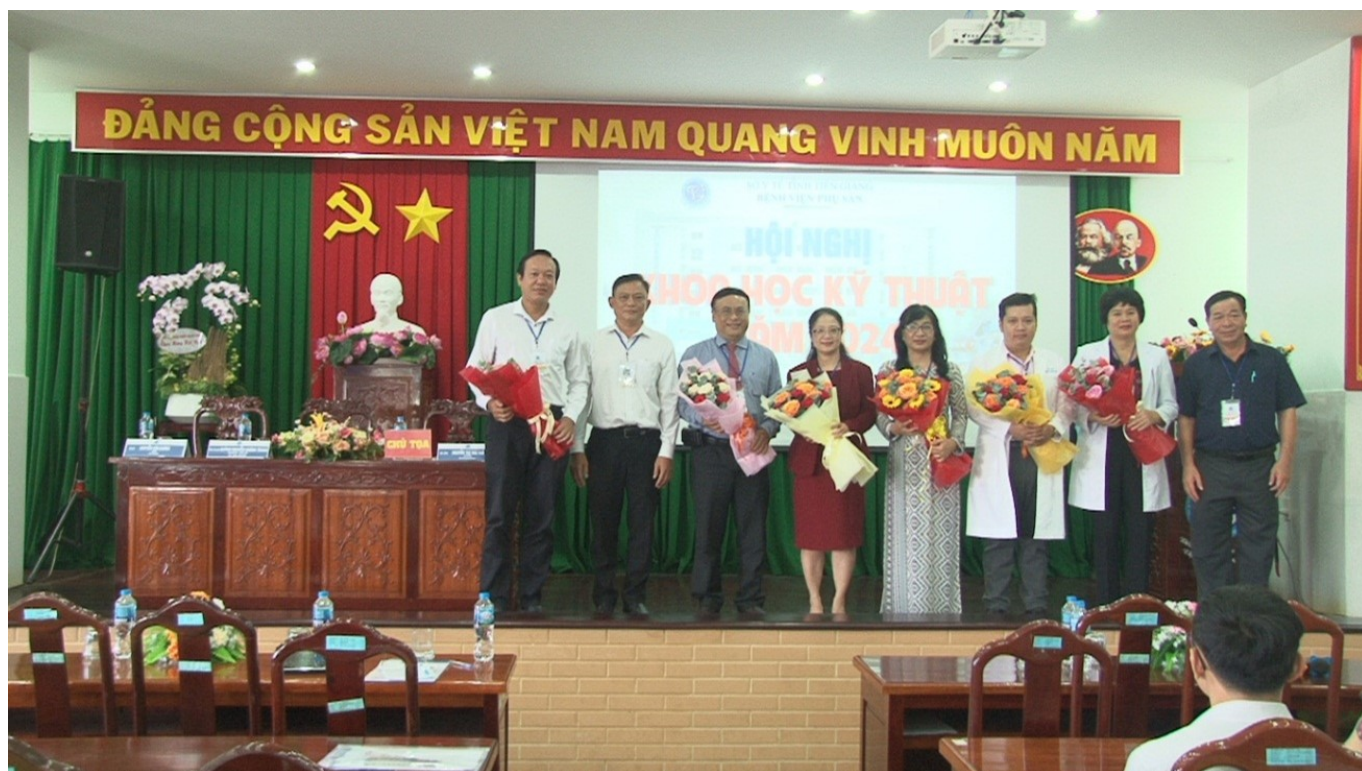
Ảnh BGD Bệnh viện tặng hoa Giám đốc Sở Y tế và các Báo cáo viên