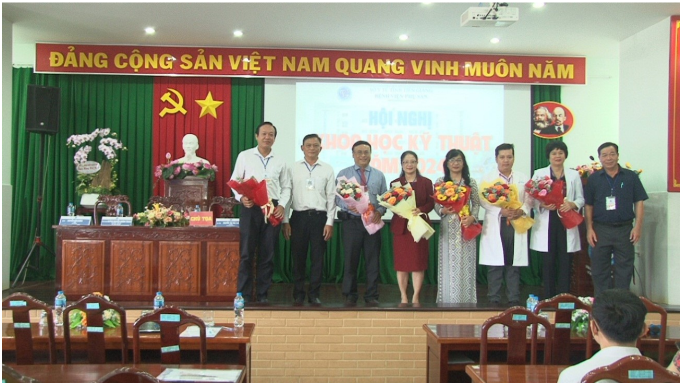
Ảnh BGD Bệnh viện tặng hoa Giám đốc Sở Y tế và các Báo cáo viên