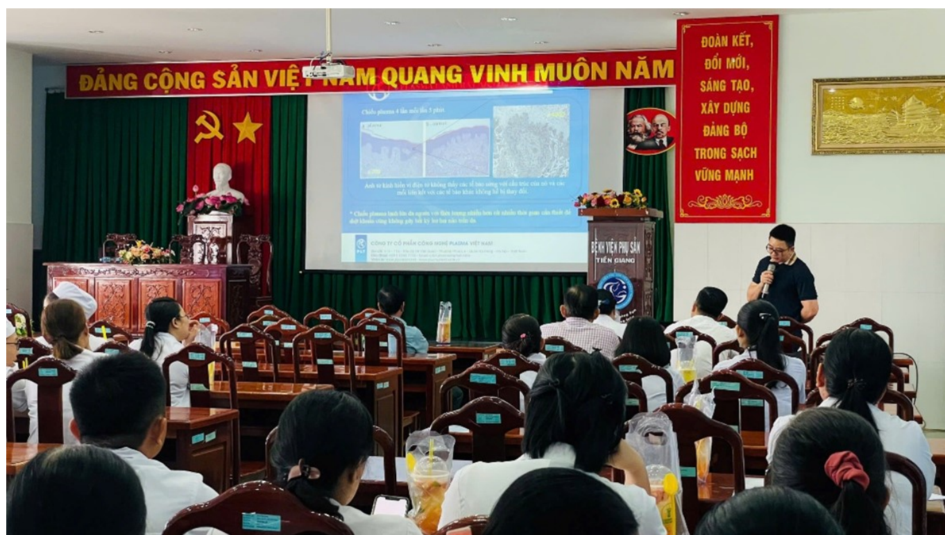
Ảnh toàn cảnh hội trường lúc tập huấn

Ngày 28/9 Bệnh viện Phụ sản Tiền Giang phối hợp với Công ty cổ phần công nghệ PLASMA Việt Nam tổ chức lớp cập nhật, trau dồi kiến thức mới về ứng dụng tia Plasma lạnh trong điều trị cho toàn thể cán bộ y tế tại bệnh viện Phụ sản tham gia thực hiện kỹ thuật chiếu tia Plasma.