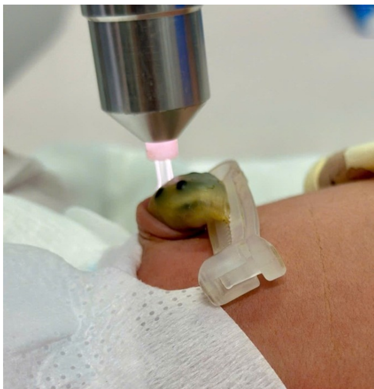
Chiếu tia Plasma lạnh cho cuộn rốn bé sơ sinh