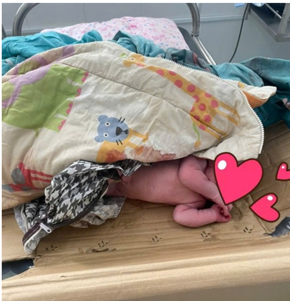
Hình ảnh bé Gái lúc mới tiếp nhận

Trưa ngày 09/8/2025, Phòng cấp cứu Bệnh viện Phụ sản Tiền Giang vừa tiếp nhận một trường hợp bé gái bị bỏ rơi. Lúc nhận, bé môi hồng, thở đều, chưa cắt dây rốn còn dính bánh nhau có mùi hôi nhiều, kiến bu làm vùng mắt và má phải bị sưng nề, vùng da đầu và gót chân trầy xước, cân nặng 3000 gr.