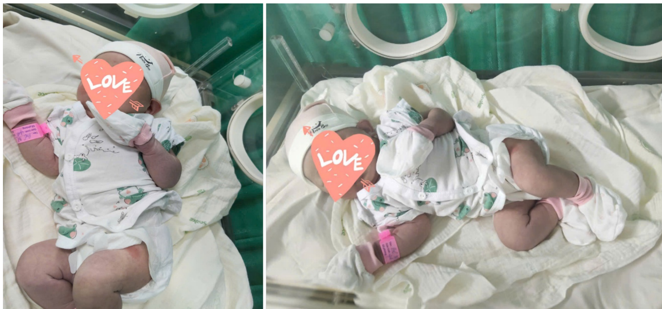
Hình ảnh bé được chăm sóc tích cực tại Phòng sơ sinh

cần thiết và chuyển bé về Phòng sơ sinh để tiếp tục theo dõi điều trị và chăm sóc bé.