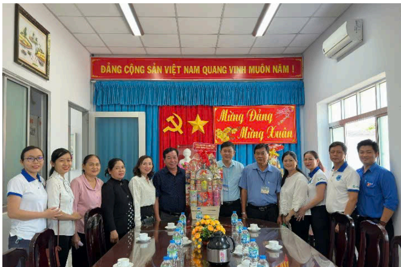
Đại diện Đoàn Bệnh viện chụp ảnh lưu niệm với cán bộ Trung tâm

Quà tặng bao gồm 100 kg gạo, 15 thùng sữa tươi, 04 hộp cà phê, 360 hộp bánh ngọt, 100 chai dầu Phật linh, Quần áo người lớn, trẻ em may sẵn, dép mủ cho các đối tượng bảo trợ xã hội của Trung tâm, tổng trị giá 25 triệu đồng, nguồn kinh phí do Tổ Công tác xã hội bệnh viện vận động các mạnh thường quân và một số viên chức bệnh viện đóng góp.