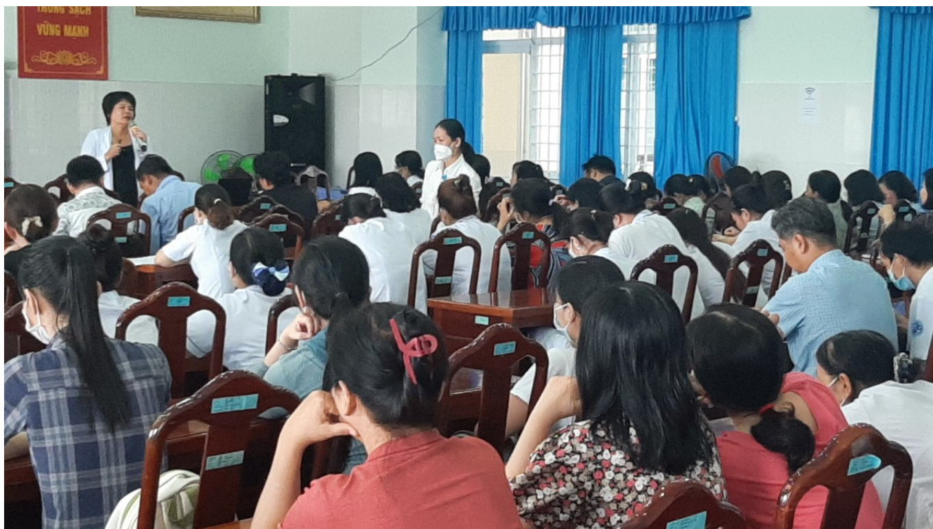
Ảnh toàn cảnh Hội trường đang tham dự tập huấn

Việc tổ chức tập huấn nhằm trang bị cho đội ngũ nhân viên y tế, sinh viên, học sinh đang làm việc, học tập tại Bệnh viện nhận biết những kiến thức cơ bản về bệnh Đậu mùa khỉ, từ đó chủ động có các biện pháp phòng, chống và phát hiện các trường hợp mắc bệnh, trường hợp nghi ngờ mắc bệnh để cách ly, điều trị sớm; đồng thời tích cực tuyên truyền, hướng dẫn, nâng cao nhận thức cho Công chức, Viên chức, Người lao động, sinh viên, học sinh trong quá trình thực hiện nhiệm vụ khám và chăm sóc sức khỏe bệnh nhân và các sản phụ tại bệnh viện./.