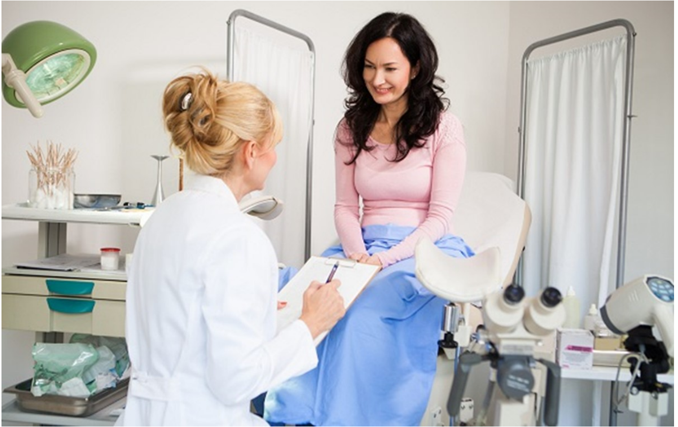
Phụ nữ đừng ngại khám phụ khoa

Ở bất kỳ độ tuổi nào, cho dù phụ nữ đã kết hôn hay chưa. Phụ nữ từ 18 tuổi trở lên hoặc đã quan hệ tình dục cần khám phụ khoa định kỳ mỗi 6 tháng đến 12 tháng. Xét nghiệm Pap smear nên được thực hiện ít nhất mỗi năm.