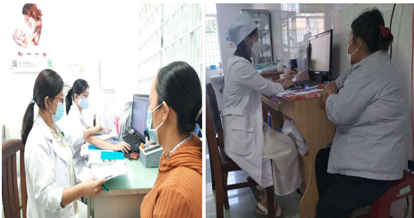
Bác sĩ tư vấn khám phụ khoa tại Bệnh viện phụ sản Tiền Giang

Từ kết quả khám phụ khoa, phụ nữ có thể được phát hiện và điều trị sớm bệnh lý phụ khoa nhằm hạn chế những biến chứng. Ngoài ra, phụ nữ sẽ có thêm các kiến thức và thông tin phụ khoa, từ đó lên kế hoạch chăm sóc và phòng ngừa để có một sức khỏe sinh sản tốt nhất.