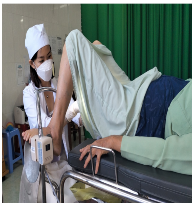
Khám phụ khoa kiểm tra hệ thống sinh dục tại BV Phụ Sản Tiền Giang