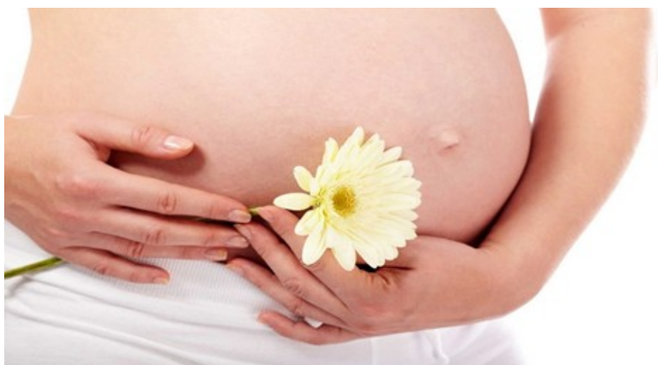
Hình minh họa

nguy cơ như: vỡ màng ối sớm, nhiễm trùng nước ối, sảy thai, sinh non, viêm màng tử cung... Chính vì vậy nếu phát hiện thấy những dấu hiệu bất thường ở vùng kín như là xuất hiện mùi hôi, tanh; ra dịch âm đạo nhiều, màu sắc bất thường như xanh, vàng;... thì cần đi thăm khám ngay. Mẹ tuyệt đối không nên e ngại vì việc khám phụ khoa khi này là cần thiết, quy trình thăm khám, điều trị sẽ được đảm bảo an toàn cho mẹ và bé.