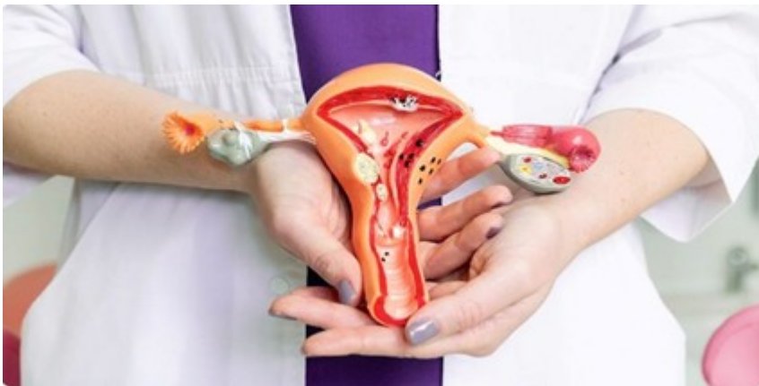
Hình ảnh minh họa

Chính vì vậy việc thăm khám phụ khoa khi mang thai là điều cực kỳ cần thiết.