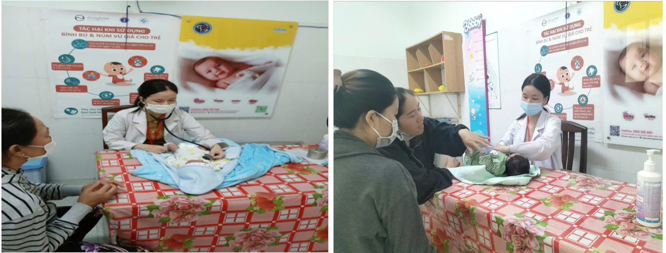
Hình ảnh các bác sĩ khám và kiểm tra sức khỏe của trẻ sơ sinh tại Bệnh viện Phụ sản Tiền Giang