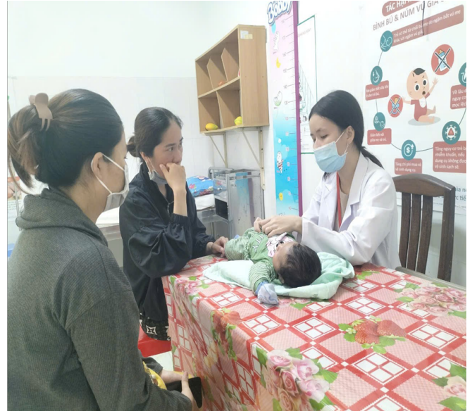
Hình ảnh bác sĩ tư vấn sức khỏe của trẻ sơ sinh cho người nhà tại Bệnh viện Phụ sản Tiền Giang