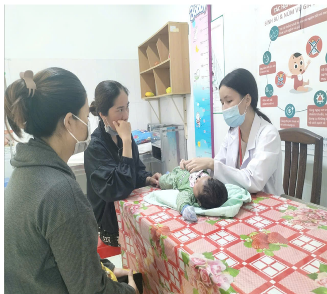
Hình ảnh bác sĩ tư vấn sức khỏe của trẻ sơ sinh cho người nhà tại Bệnh viện Phụ sản Tiền Giang