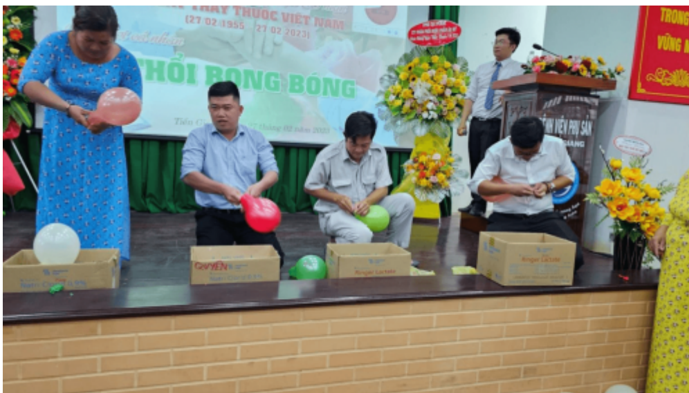
Viên chức, người lao động sôi nổi tham gia trò chơi Thổi bóng bóng

Sau những phút giây lắng đọng, cùng nhau ôn lại kỷ niệm ngày Thầy thuốc Việt Nam 27/2, toàn thể viên chức, người lao động bệnh viện Bệnh viện Phụ sản Tiền Giang bước vào chương trình các trò chơi vô cùng sôi nổi.