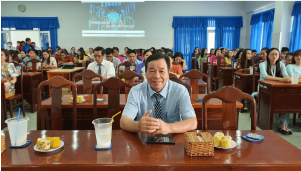
Buổi họp mặt tại Bệnh viện Phụ sản Tiền Giang ngày 27/2

Chiều 27/02/2023, Bệnh viện (BV) Phụ sản Tiền Giang tổ chức buổi họp mặt kỷ niệm 68 năm ngày Thầy thuốc Việt Nam 27/02/1955 - 27/02/2023 đây là dịp để tập thể viên chức, người lao động giao lưu văn nghệ, giải trí với những trò chơi thú vị và sôi nổi sau những ngày làm việc vất vả.