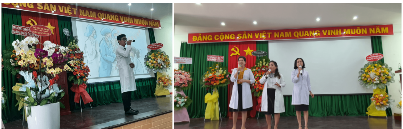
Văn nghệ chào mừng Kỷ niệm 68 năm Ngày Thầy thuốc Việt Nam (27/2/2023)

Mở đầu chương trình Họp mặt Kỷ niệm 68 năm Ngày Thầy thuốc Việt Nam (27/2/2023) là các tiết mục văn nghệ của đội Văn nghệ Bệnh viện Phụ sản Tiền Giang, với các tiết mục đơn ca, song ca, tam ca và tốp ca.