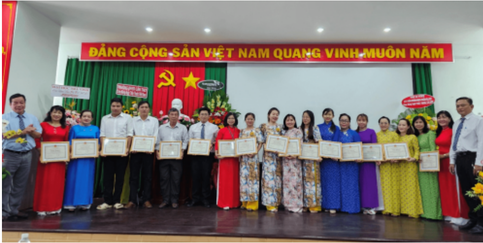
Cán bộ y tế nhận giấy khen của Sở Y tế trong công tác phòng chống đại dịch COVID-19

Sau những phút giây lắng đọng, cùng nhau ôn lại kỷ niệm ngày Thầy thuốc Việt Nam 27/2, toàn thể viên chức, người lao động bệnh viện Bệnh viện Phụ sản Tiền Giang bước vào chương trình các trò chơi vô cùng sôi nổi.