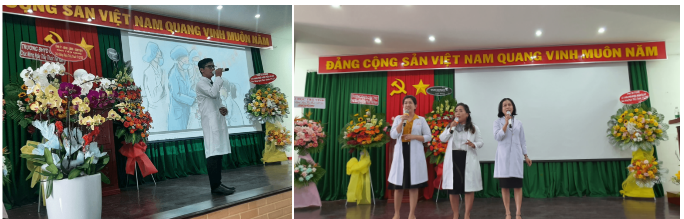
Văn nghệ chào mừng Kỷ niệm 68 năm Ngày Thầy thuốc Việt Nam (27/2/2023)

Mở đầu chương trình Họp mặt Kỷ niệm 68 năm Ngày Thầy thuốc Việt Nam (27/2/2023) là các tiết mục văn nghệ của đội Văn nghệ Bệnh viện Phụ sản Tiền Giang, với các tiết mục đơn ca, song ca, tam ca và tốp ca.