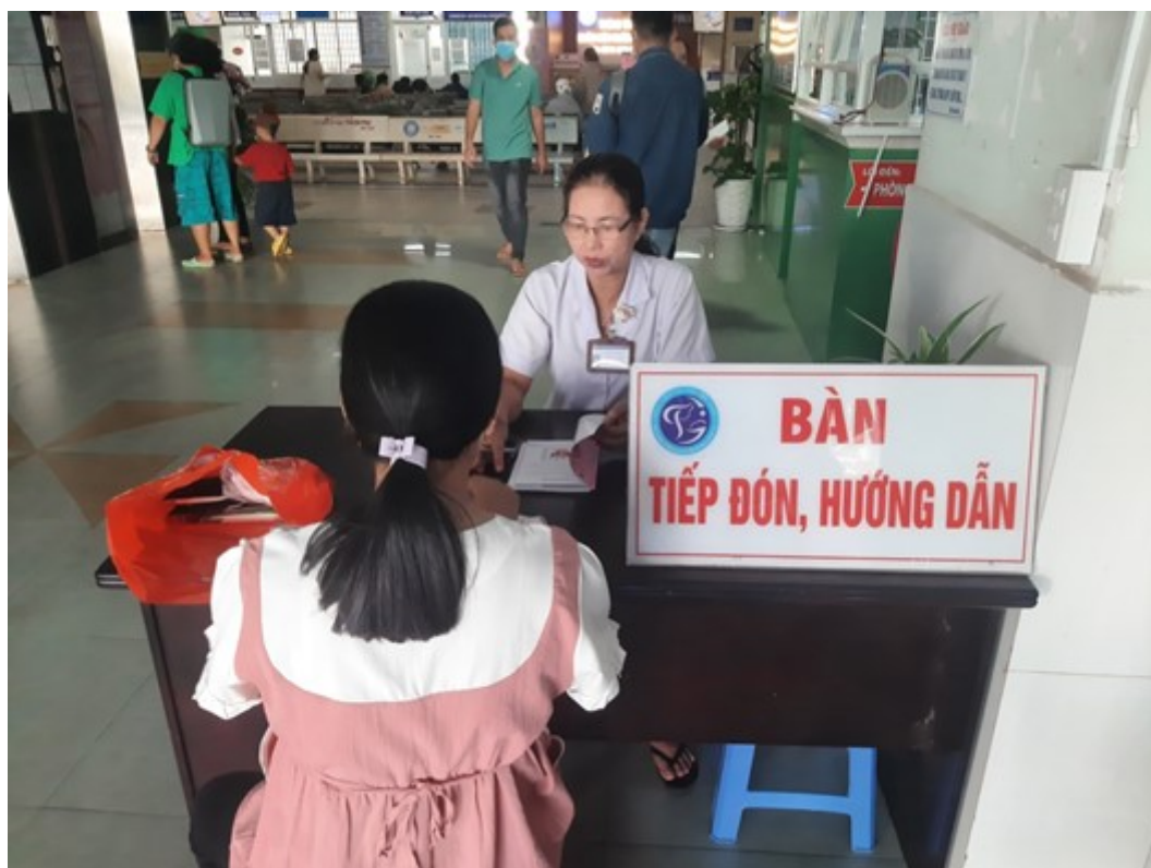
Nhân viên Tổ Công

So với trước đây, người bệnh khi đi khám bệnh phải mang nhiều loại giấy tờ, mất nhiều thời gian chờ đợi để kiểm tra xác nhận thông tin trên thẻ BHYT và giấy tờ tùy thân khác thì việc triển khai sử dụng thẻ CCCD vào khám, chữa bệnh BHYT đã giúp cả nhân viên y tế và người dân tiết kiệm được nhiều thời gian do các thủ tục khi đi khám, chữa bệnh tại bệnh viện.