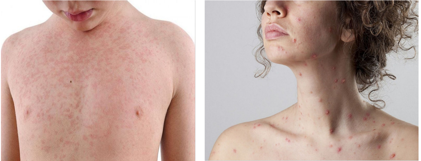
Hình ảnh: Các nốt ban biểu hiện của bệnh Rubella