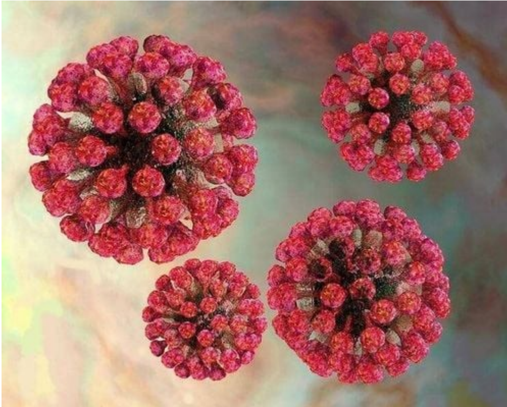
Hình ảnh: Virus Rubella